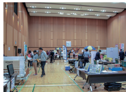
千葉ふれプラの最大のイベント「千葉県福祉機器展」

理者は手探り状態でした。取り消しを受けた指定管理者も出たほどです。その後、類似した公立施設同士で情報交換をするなど学び合って現在があります。中心となったのは、WACと同じ公益社団法人の全国公立文化施設協会でした。時代によって出てくる問題も変わります。県や地域の信頼を勝ち得た今こそ、常にアンテナを磨いて時代の波に乗った運営をしてみたいです。