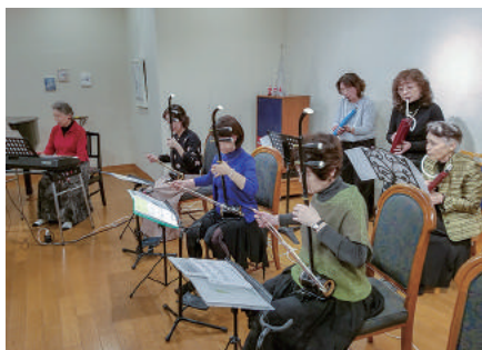
地元音楽サークルの練習会

「故郷の人吉にギャラリーを開きたい」と夢に向かって準備を始めた時、たくさんの壁にぶつかりました。人吉・球磨にもたくさんのアーティストがいますが、新参のギャラリーを利用するのでしょうか。そもそも人口の少ない人吉・球磨で集客できるで