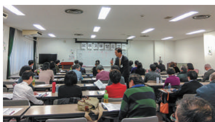
1月18日の再就職支援セミナー。筆者が講師を務めました。

シニア世代を取り巻く環境は「少子高齢化の急激な進行による労働者不足」「一億総活躍社会の実現に向けた人生100年時