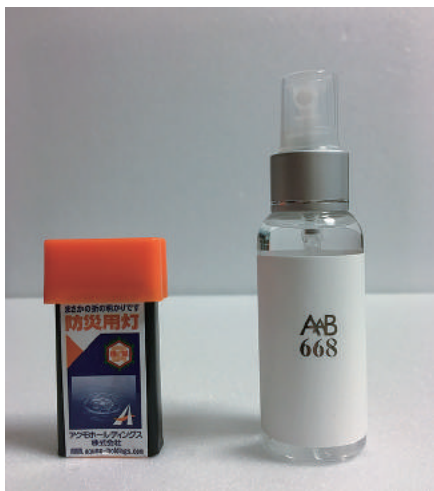
アクモキャンドル（左）とAAB668

「シナジー」は、一級建築士、介護支援システム開発者、内装の壁や床の特殊施工者など多様な業種の間が、仕事を通じて知り合い、集まった仲間、名称は相乗効果を意味しています。