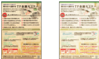
シニアの視界再現により読みづらさを再現